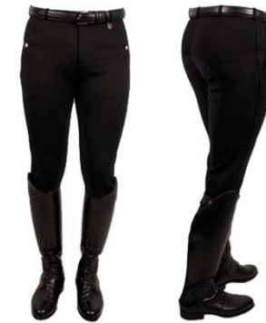
Bryczesy 2/3 pary