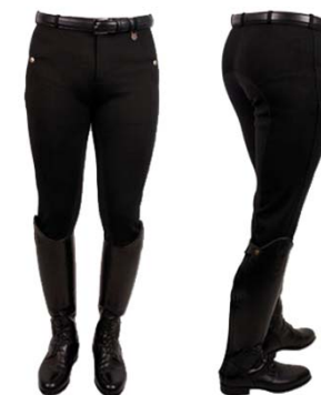
Bryczesy 2/3 pary