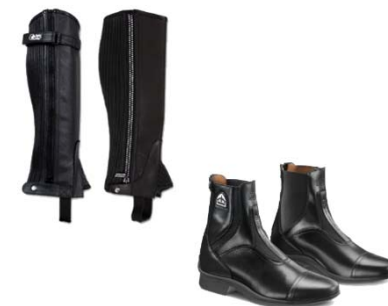
Sztylpy i Sztyblety