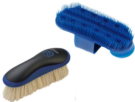
Miękka i plastikowa szczotka