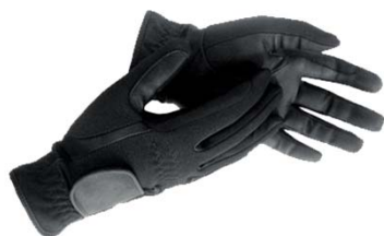
Rękawiczki 2 pary